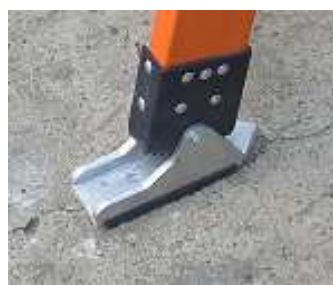
Zapatas antideslizantes Porta zapata Alto impacto