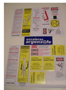
ETIQUETAS DE SEGURIDAD