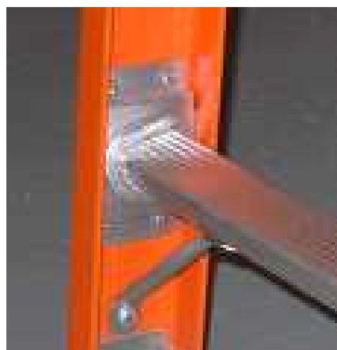
Escuadras de Refuerzo Anti-Torsión