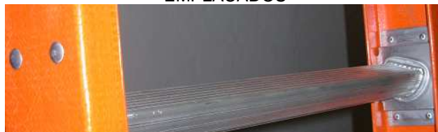
Peldaños Planos en D – DURALUMINIO EMPLACADOS